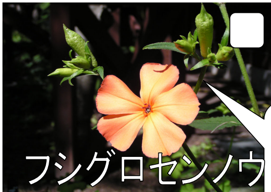
フシグロセンノウ